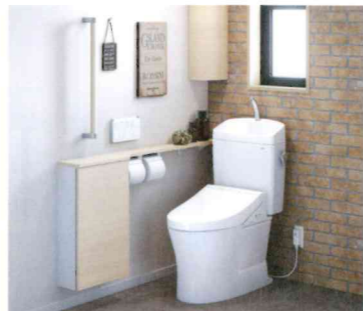
節水型トイレ：ピュアレストQR 手すりの設置：レストルームドレッサー コンフォートシリーズ