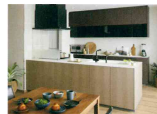
キッチンセットの交換を伴う対面化改修： システムキッチン ザ・クラッソ