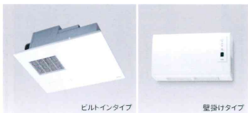
浴室乾燥機：浴室換気暖房乾燥機「三乾王」