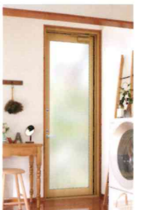
ドア交換：ドアリモ 勝手口ドア