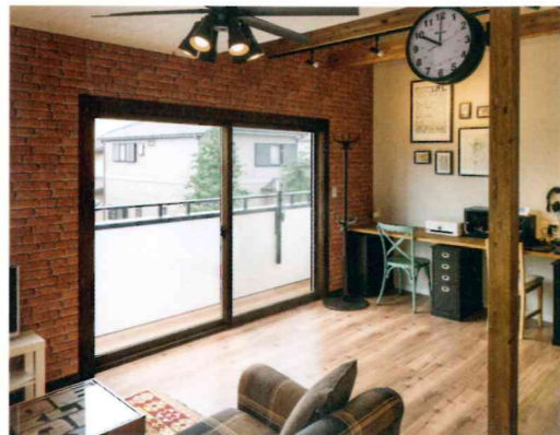
外窓交換：マドリモ 断熱窓戸建用