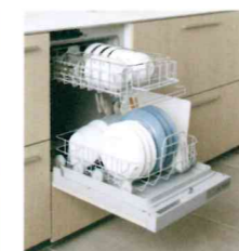
ビルトイン食器洗機