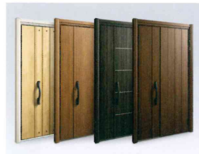
ドア交換：ドアリモ 玄関ドア D30